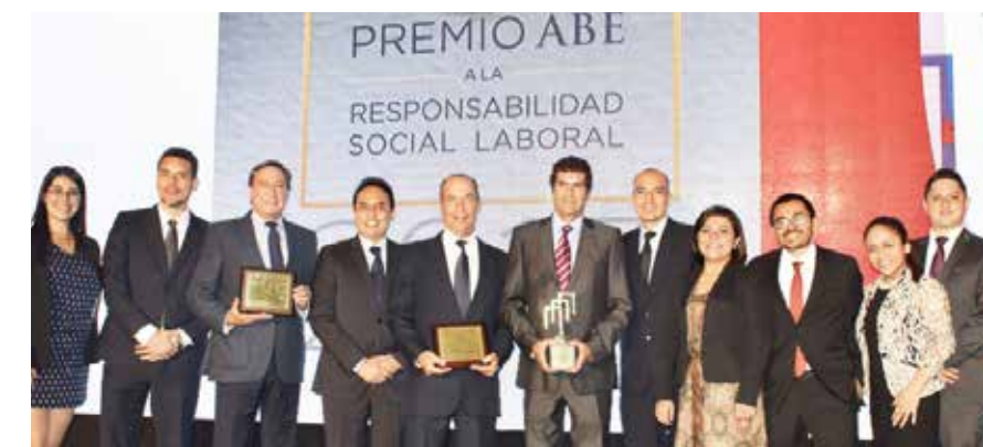
Equipo de UNICON en la ceremonia de Premiación ABE a la Responsabilidad Social Laboral en 2017