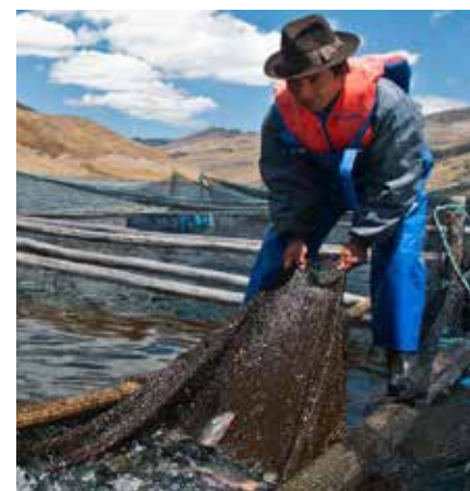
Proyecto de cultivo y comercialización de trucha en la comunidad de Tanta, Yauyos, área de influencia directa de CELEPSA

Es una red latinoamericana que reúne a 67 fundaciones empresariales y empresas en 11 países que hacen inversión social privada en las comunidades con un enfoque de desarrollo básico.